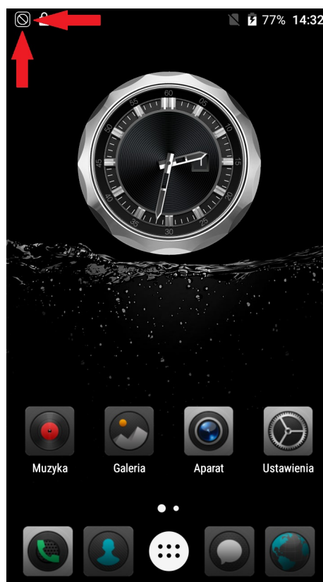
Ilustracja 2: Widok głównego ekranu, zaznaczono ikonę włączonej funkcji ShieldingKeys

Funkcję umieszczono w górnej belce opcji telefonu.