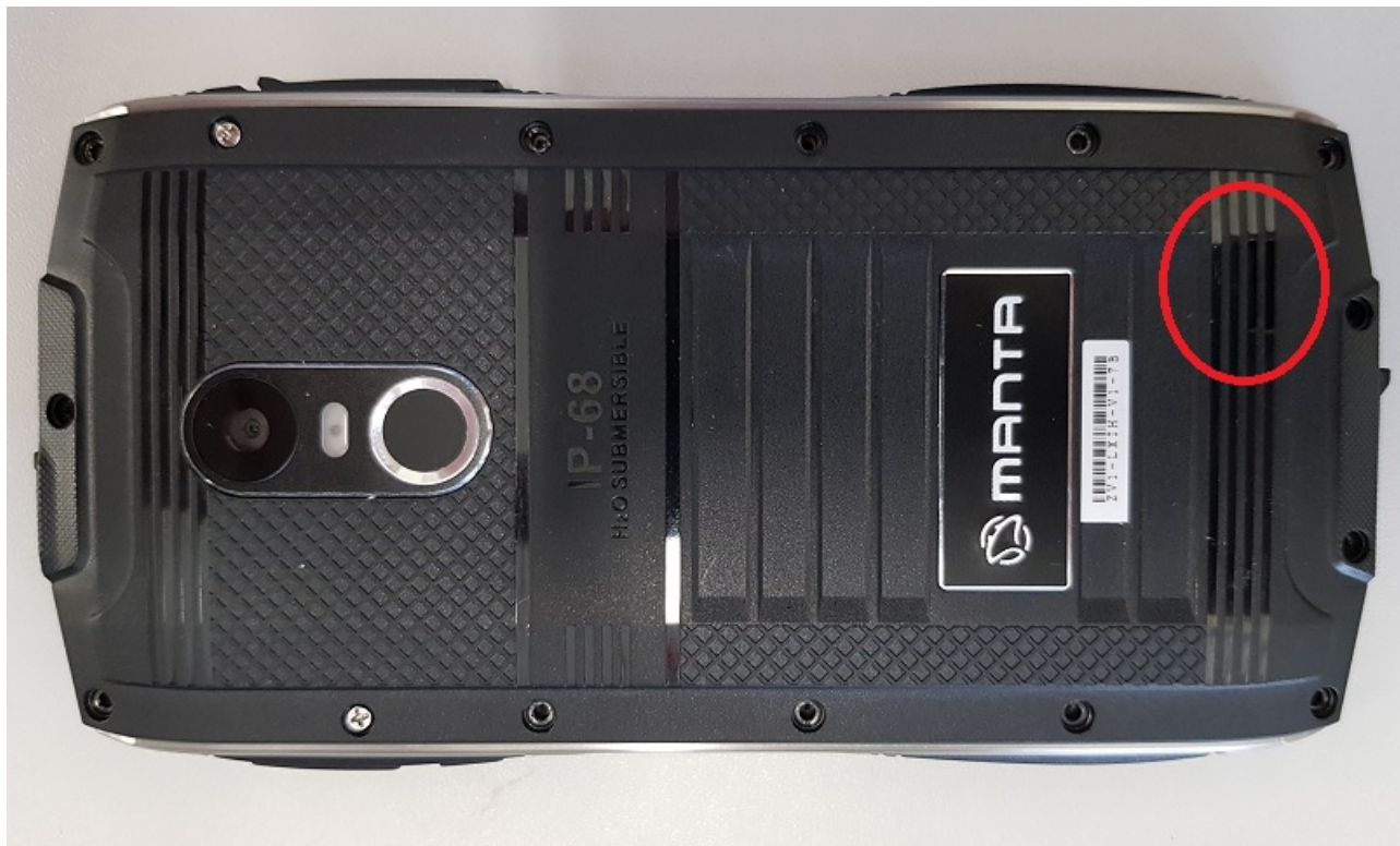
Ilustracja 1: Czerwonym okręgiem oznaczono miejsce mocowania uszczelki

Po zdjęciu osłon i odkręceniu wszystkich mocujących śrub. Należy podgrzać okolice głośnika. Ponieważ głośnik jest przyklejony do wnętrza tylnej obudowy specjalną taśmą. Temperatura strumienia powietrza powinna mieć około 140 -150 stopni Celsjusza. Umożliwi to zdjęcie obudowy bez uszkodzenia uszczelniającej taśmy.