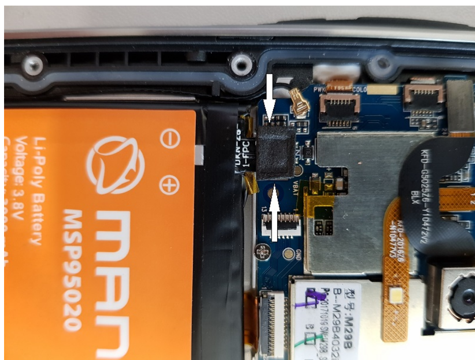
Ilustracja 2: Naklejona podkładka gąbkowa przytrzymująca złącze baterii