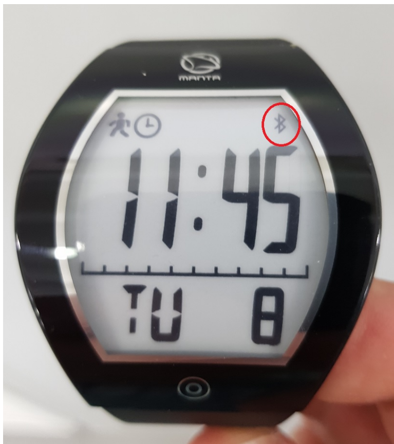
Ilustracja 3: Widok ekranu głównego, czerwonym okręgiem oznaczono ikonę połączenia bluetooth

Gdy zegarek będzie połączony z telefonem na ekranie wyświetli się logo Bluetooth.